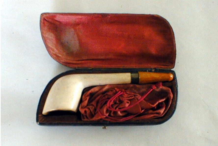
Slika 5. LULA I CIGARETNIK U ETUIJU stiva, jantar, pozlaćeni mjedni okov, 19.st. vel. 5,5 x 13,5 cm; Arhiv Muzeja za umjetnost i obrt

Kutije za cigare (primjer je prikazan na slici 6) sastoje se većim dijelom od furnira koji je tanka daščica, debljine 0,6 – 3,5 mm. Dobiva se od finih drva poput hrastovine, orahovine, jasenovine i drugih. Prema načinu dobivanja, dijeli se na rezani i ljušteni furnir. Rezani furnir dobiva se rezanjem prethodno pripremljenih trupaca furnirskim nožem i upotrebljava se za dekorativno oblaganje drvnih ploča, dok se ljušteni dobiva ljuštenjem trupaca pomoću ljuštilica i upotrebljava se uglavnom za proizvodnju furnirskih ploča. 20