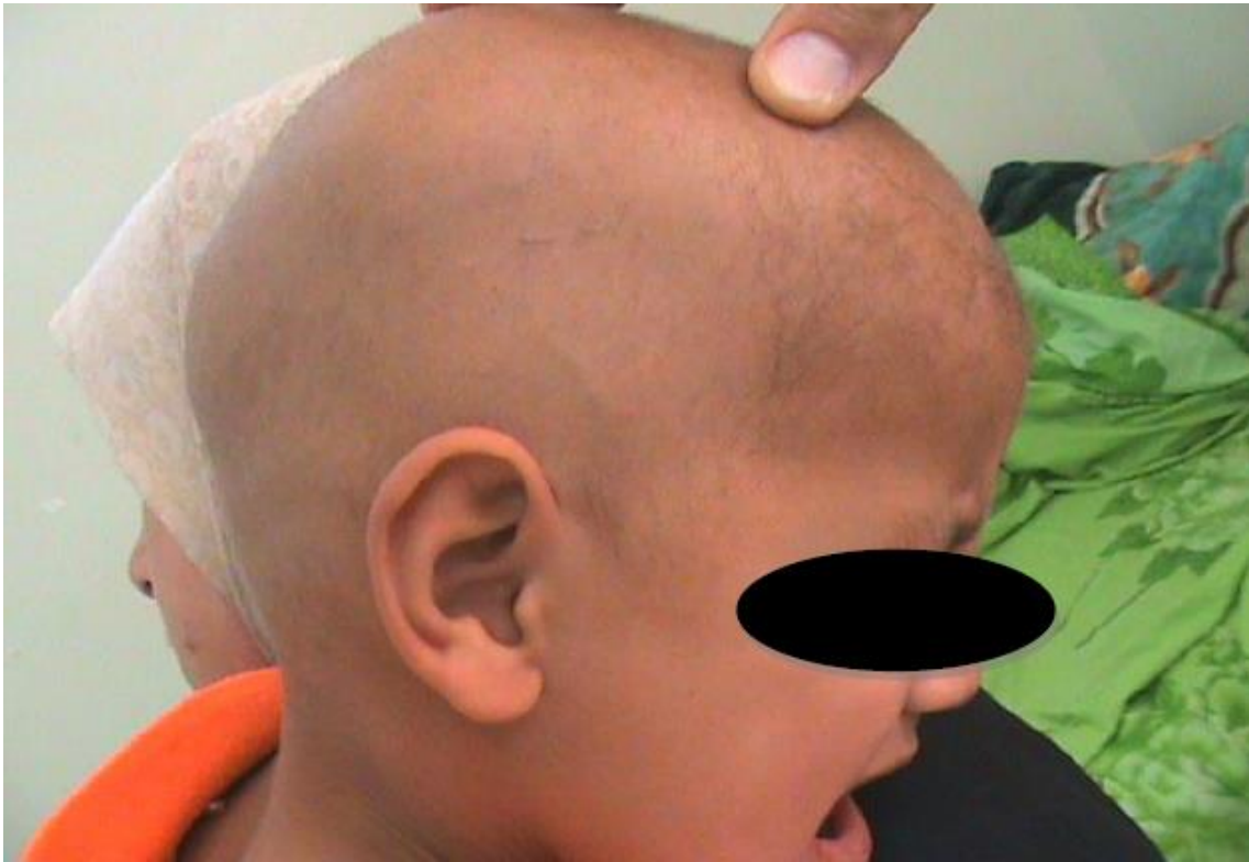
Slika 9. Gubitak kose kod četverogodišnjeg pacijenta koji je bio izložen taliju [92]

10 članova dvije obitelji otrovali su se nakon što su jeli tortu kontaminiranu talijem. Četiri slučaja (majka, otac i dvoje djece) su članovi jedne obitelji i 6 slučaja (majka, otac i četvero djece) su članovi druge obitelji. U tablici 10 prikazana je statistika slučajeva, inicijalni simptomi, interval od izloženosti pa do pojave prvih simptoma te koncentracije talija u tijelu pacijenata. Devet pacijenata jelo je tortu kontaminiranu talijem, dok je jedan od njih dijete kojeg je majka hranila svojim mlijekom.