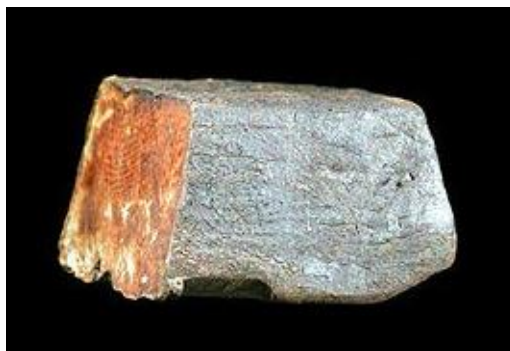
Slika 2. Izgled talija [7]

Talij se u prirodi pojavljuje kao mono- i tro -valentni element. Talij(III) spojevi relativno su nestabilni i lako prelaze u Tl^+ -ion. [14] Od talijevih spojeva s oksidacijskim brojem +1 važno je spomenuti talij(I) fluorid i talijev hidroksid koji su topljivi u vodi te talijev sulfat ( Tl_2SO_4 ), koji je najpoznatiji i najkorišteniji talijev spoj. Talij tvori mnoge soli, primjerice acetate, karbonate i sulfate.