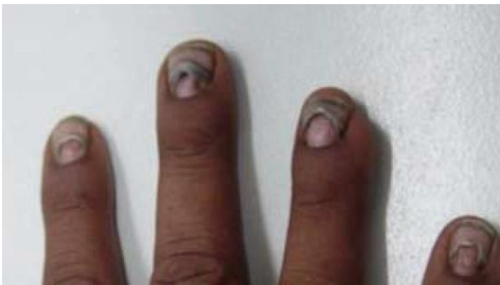
Slika 4. Distorfija noktiju – Messove linije [1]

U slučajevima kroničnog trovanja, simptomi su slični ali općenito blaži nego u slučajevima akutne intoksikacije. Obdukcije ili biopsije tijela nakon trovanja talijem, otkrivaju oštećenja različitih organa. Primjerice, nakon gutanja letalne doze dolazi do krvarenja u sluznici crijeva, plućima, endokrinim žlijezdama i srcu, masnih nakupina na jetri i srčanom tkivu te degenerativnih promjena bubrega. U mozgu dolazi do masne degeneracije ganglijskih stanica, oštećenja aksona i dezintegracija mijelinskih ovojnica. Varijacije krvnog tlaka posljedica su učinka talija na autonomni živčani sustav. U smrtonosnim trovanjima dolazi do teških trajnih oštećenja živaca, dok se kod subletalnih trovanja može postići djelomični oporavak u roku od dvije godine. Mogu se razviti i vizualni poremećaji te trajati mjesecima nakon prestanka liječenja. O učincima talija na reprodukciju kod čovjeka postoji malo podataka. Poznato je da može negativno utjecati na menstrualne cikluse, libido, mušku potenciju i plodnost. Poznato je oko dvadesetak slučajeva trovanja talijem tijekom trudnoće i osim relativno male težine i alopecije nije bilo zabilježeno drugih simptoma na novorođenčadi. [21]