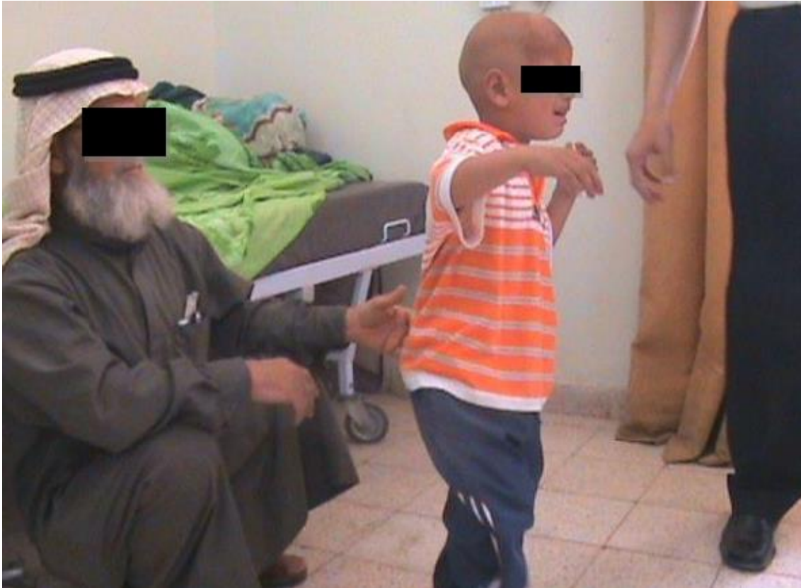
Slika 7. Pacijent pokušava hodati uz pomoć roditelja [92]