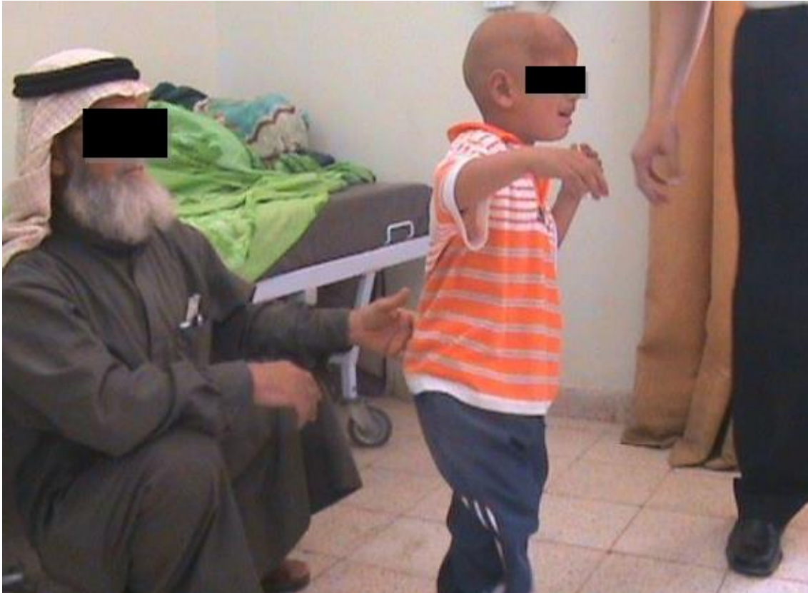
Slika 7. Pacijent pokušava hodati uz pomoć roditelja [92]