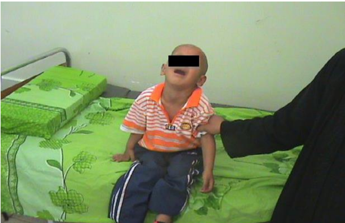
Slika 8. Pacijent pokušava sjediti uz pomoć roditelja [92]