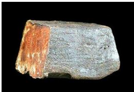
Slika 2. Izgled talija [7]

Talij se u prirodi pojavljuje kao mono- i tro -valentni element. Talij(III) spojevi relativno su nestabilni i lako prelaze u Tl^+ -ion. [14] Od talijevih spojeva s oksidacijskim brojem +1 važno je spomenuti talij(I) fluorid i talijev hidroksid koji su topljivi u vodi te talijev sulfat ( Tl_2SO_4 ), koji je najpoznatiji i najkorišteniji talijev spoj. Talij tvori mnoge soli, primjerice acetate, karbonate i sulfate.