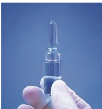
Slika 2. ETANOL-KLORBENZENSKI DOZIMETAR, ECB