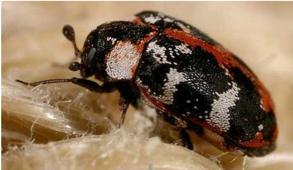
Slika 12. KOŽUŠKARI

Cigarete u sebi sadrže celulozu koja služi kao hrana raznim gljivicama i insektima koje napadaju papir iz arhiva, muzeja i knjižnica, što uzrokuje njihovo propadanje (slika 13).