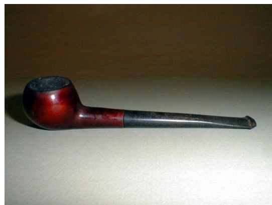
Slika 8. LULA bruyère; 20. st. utisnuto: BRUYERE GARANTIE duž. 13 cm ; promjer 3 cm