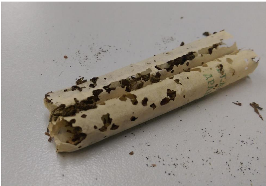
Slika 13. CIGARETE IZ KOLEKCIJE PRIBORA ZA PUŠENJE

Cigarete u sebi sadrže celulozu koja služi kao hrana raznim gljivicama i insektima koje napadaju papir iz arhiva, muzeja i knjižnica, što uzrokuje njihovo propadanje (slika 13).