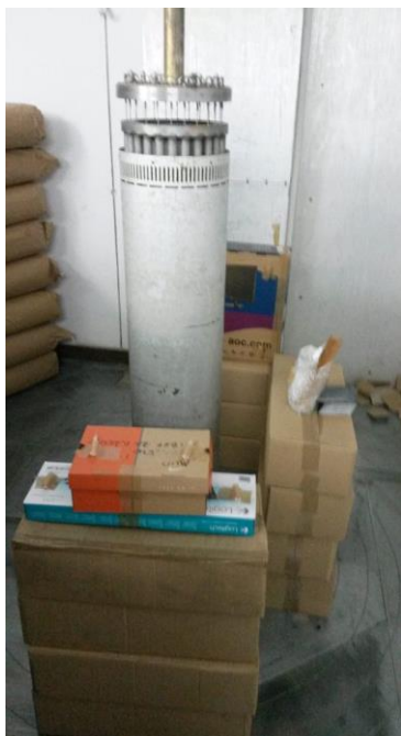
Slika 10. IZVOR ZRAČENJA

U Hrvatskoj raspolažemo višenamjenskim panoramskim uređajem za ozračivanje gama zrakama ^{60}\text{Co} u Laboratoriju za radijacijsku kemiju i dozimetriju (LRKD) Instituta Ruđer Bošković (IRB).