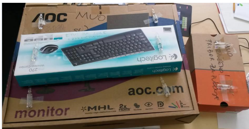
Slika 14. ECB DOZIMETRI NA KUTIJAMA KOJE SADRŽE PRIBOR ZA PUŠENJE

Predmeti iz kolekcije raspoređeni su u tri kutije različitih veličina, te su dva predmeta zamotana u zaštitnu foliju i nisu bili u niti jednoj kutiji. Dozimetri su zalijepljeni na kutije na određena mjesta kako bi zabilježili raspodjelu apsorbirane doze po cijeloj kutiji. Slika 14 prikazuje kutije oblijepljene dozimetrima, a tablica 2 opisuje dimenzije kutija i dozimetre kojima je praćena raspodjela doze.