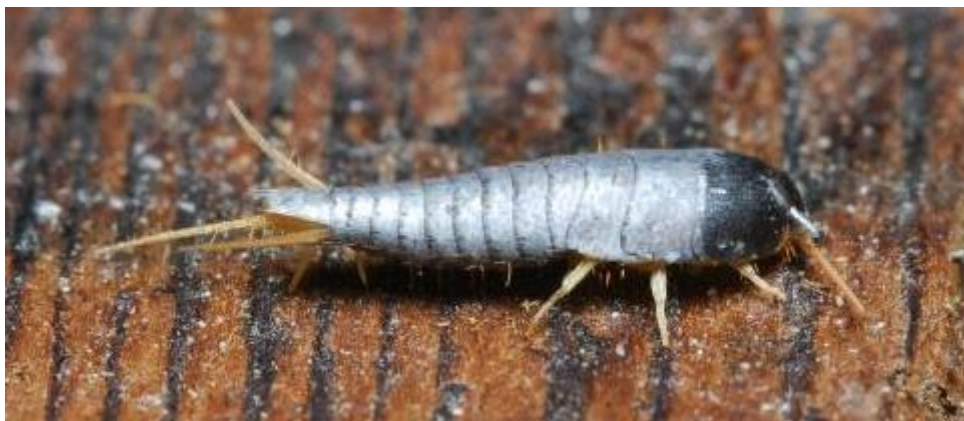
Slika 11. SREBRNA RIBICA

Kod tekstila uočeni su ostatci srebrne ribice . Srebrne ribice (slika 11) su sitni beskrilni insekti. Ime su dobile zbog svoje srebrne boje i pokreta poput ribe. Veličine su između 13-30 mm. Prehrana im se bazira na šećerima i škrobu.