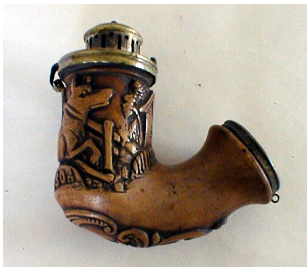
Slika 7. LULA stiva, mjed; 1803. na okovu utisnuto: LR vel. 11 x 10 cm

Korijen, francuskog naziva bruyère , biljke Erica arborea (Drvenasta crnjuša) je iznimno čvrst, otporan na toplinu i apsorbira vlagu te je zbog tih svojstva pogodan za izradu lula. Korijen veličine nogometne lopte, star između 30 do 60 godina se izvadi iz tla, te se kuha par sati i nakon toga se suši nekoliko mjeseci prije nego bude dalje obrađivan. Drvo je svijetlo smeđe do crveno smeđe boje i lijepe teksture. Osim što je vrlo čvrst i otporan na visoke temperature, također ne utječe na aromu duhana. Materijal se još koristi za izradu nakita i drški noževa. 22