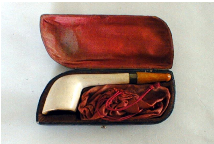
Slika 5. LULA I CIGARETNIK U ETUIJU stiva, jantar, pozlaćeni mjedni okov, 19.st. vel. 5,5 x 13,5 cm

Kutije za cigare (primjer je prikazan na slici 6) sastoje se većim dijelom od furnira koji je tanka daščica, debljine 0,6 – 3,5 mm. Dobiva se od finih drva poput hrastovine, orahovine, jasenovine i drugih. Prema načinu dobivanja, dijeli se na rezani i ljušteni furnir. Rezani furnir dobiva se rezanjem prethodno pripremljenih trupaca furnirskim nožem i upotrebljava se za dekorativno oblaganje drvnih ploča, dok se ljušteni dobiva ljuštenjem trupaca pomoću ljuštilica i upotrebljava se uglavnom za proizvodnju furnirskih ploča. 20