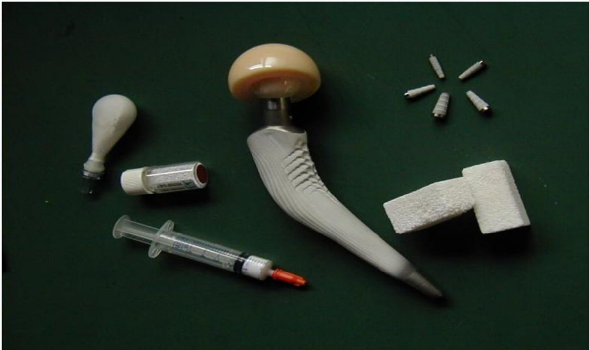
Slika 3. Komercijalni primjere biokeramike za medicinske svrhe [17].

trikalcijevi -fosfati. Slika 3. prikazuje komercijalne primjere biokeramike korištene u medicinske svrhe [17].