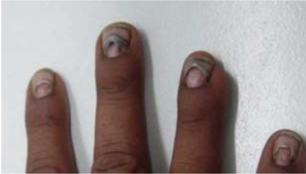
Slika 4. Distorfija noktiju – Messove linije [1]

U slučajevima kroničnog trovanja, simptomi su slični ali općenito blaži nego u slučajevima akutne intoksikacije. Obdukcije ili biopsije tijela nakon trovanja talijem, otkrivaju oštećenja različitih organa. Primjerice, nakon gutanja letalne doze dolazi do krvarenja u sluznici crijeva, plućima, endokrinim žlijezdama i srcu, masnih nakupina na jetri i srčanom tkivu te degenerativnih promjena bubrega. U mozgu dolazi do masne degeneracije ganglijskih stanica, oštećenja aksona i dezintegracija mijelinskih ovojnica. Varijacije krvnog tlaka posljedica su učinka talija na autonomni živčani sustav. U smrtonosnim trovanjima dolazi do teških trajnih oštećenja živaca, dok se kod subletalnih trovanja može postići djelomični oporavak u roku od dvije godine. Mogu se razviti i vizualni poremećaji te trajati mjesecima nakon prestanka liječenja. O učincima talija na reprodukciju kod čovjeka postoji malo podataka. Poznato je da može negativno utjecati na menstrualne cikluse, libido, mušku potenciju i plodnost. Poznato je oko dvadesetak slučajeva trovanja talijem tijekom trudnoće i osim relativno male težine i alopecije nije bilo zabilježeno drugih simptoma na novorođenčadi. [21]